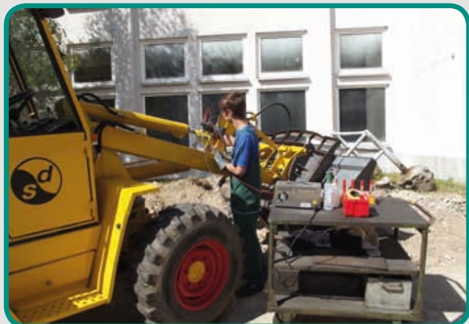
Reparatur einer Kolbenstange im montierten Zustand