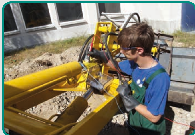
Reparatur einer Kolbenstange mit Dichtungstausch